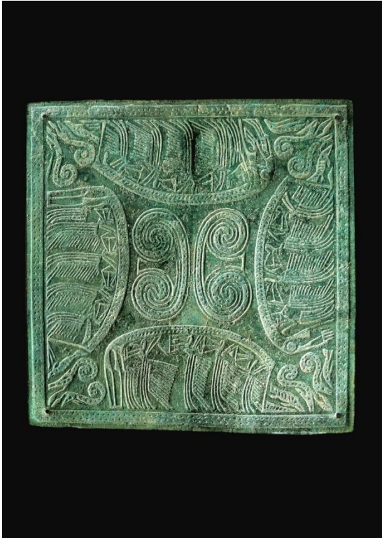
Plaque. Nord du Vietnam. Culture de Đông Sơn. III e -II e siècle avant notre ère. Bronze. H. 16,5 cm. Inv. 2505-10. Musée Barbier-Mueller.