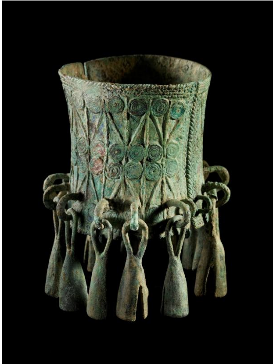
Bracelet avec grelots. Vietnam. Culture de Đông Sơn, variante de Lang Vac. IV e siècle avant notre ère – II e siècle de notre ère. Bronze. H. 7,4 cm. Inv. 2505-45. Musée Barbier-Mueller.