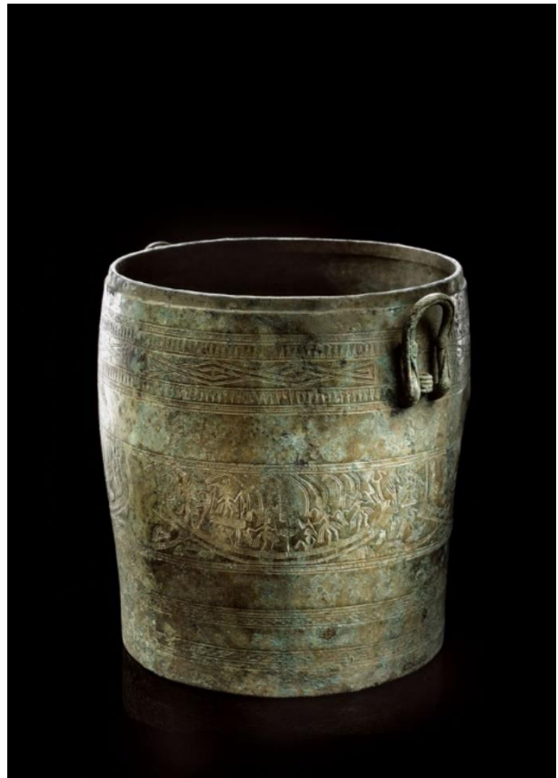
Situle thap . Nord du Vietnam. Culture de Đông Sơn. IV e -III e siècle avant notre ère. Bronze. H. 42 cm, poids 11,5 kg. Inv. 2505-29. Musée Barbier-Mueller.