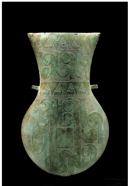
Grande urne ou « flasque ». Indonésie, Bornéo ? Derniers siècles avant notre ère – premiers siècles de notre ère. Bronze H. 74 cm, poids 11,9 kg. Inv. 2505-17. Musée Barbier-Mueller.