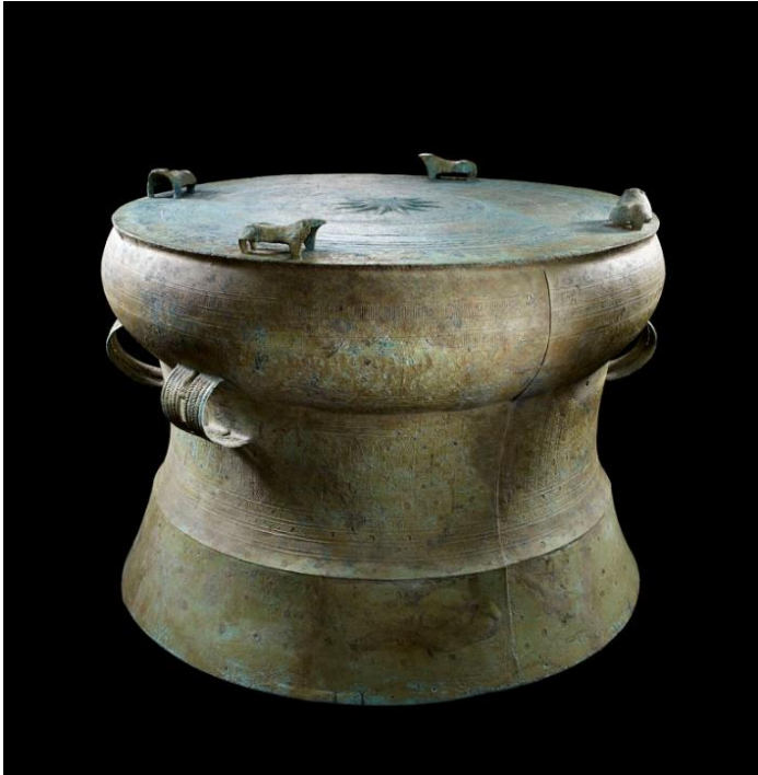
Tambour de type Heger I. Nord du Vietnam, région sud du berceau de la culture de Đông Sơn. Époque Giao Chi, dernière période, I er siècle avant notre ère – III e siècle de notre ère. Bronze. H. 73 cm ; diam. 93 cm. Inv. 2505-84. Musée Barbier-Mueller.