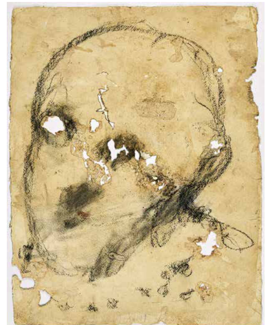
Miquel Barceló (né en 1957), De B mon , 2009, technique mixte sur papier, 65 x 51 cm. PHOTO : LUIS LOURENÇO © MIQUEL BARCELÓ ADAGP PARIS 2023